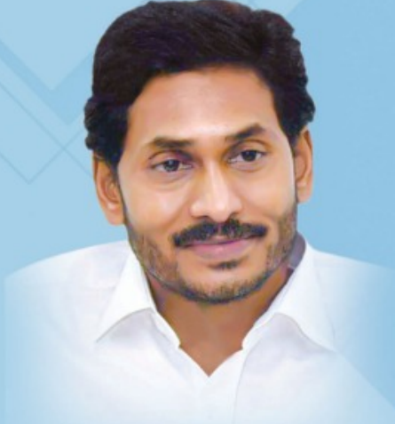
శ్రీ వై.యస్. జగన్నాథాన్ రెడ్డి గారు గౌ. ముఖ్యమంత్రి వర్కులు ఆంధ్రప్రదేశ్ ప్రభుత్వం